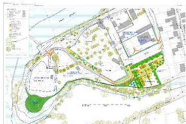
Le pôle de loisirs de Cercy-la-Tour

Il s'agit également de prendre en compte les fragilités des centralités du territoire en matière d'offre de service et d'y trouver une réponse adaptée.