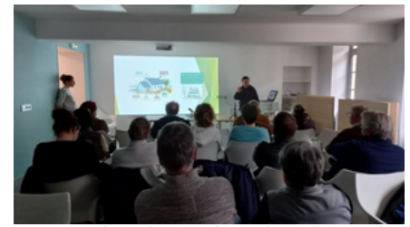
La Maison de l'Habitat itinérante à Moulins-Engilbert

Informier et communiquer, c'est le principe de la Maison de l'Habitat Itinérante dont la première édition s'est tenue à Moulins-Engilbert et dont la seconde se tiendra à Cercy La Tour au mois d'avril. Cette maison de l'habitat itinérante bénéficie d'actions de communication renforcées et se tient sous un format événementiel, participant ainsi à la redynamisation des villes et villages du territoire demandeurs. D'autres acteurs peuvent y être associés comme les entreprises locales du BTP.