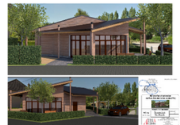
Le futur parc Résidentiel de loisirs de Châtillon-en-Bazois

Que ce soit au sujet de la santé avec l'extension de la maisons de santé de Moulins-Engilbert, de la culture avec le projet de pôle culturel l'Esquisse à Luzy ou la médiathèque à Moulins-Engilbert, de loisirs avec le pôle de loisir de Cercy La Tour ou de tourisme avec le parc résidentiel de loisir à Chatillon en Bazois, de nombreux projets voient le jour.