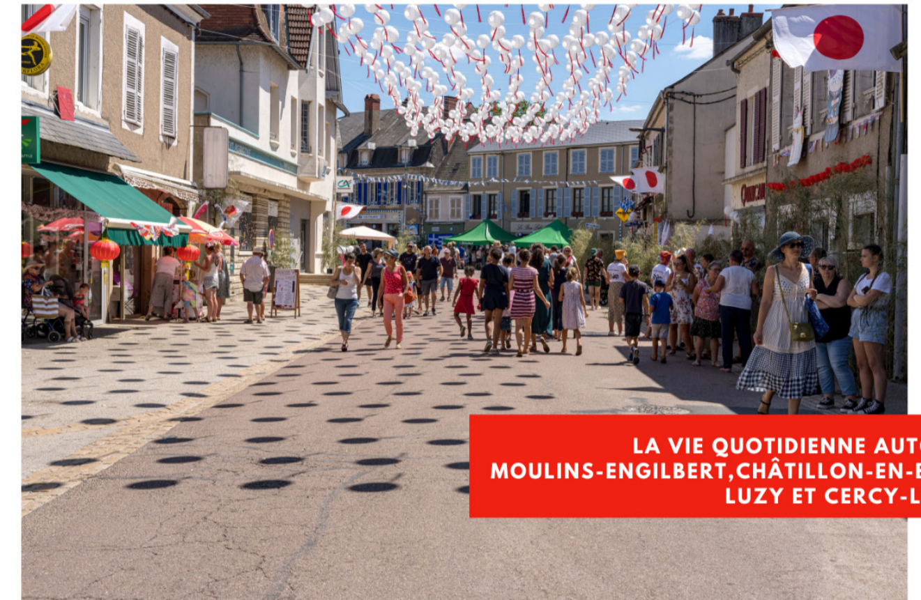
LA VIE QUOTIDIENNE AUTOUR DE MOULINS-ENGILBERT, CHÂTILLON-EN-BAZOIS, LUZY ET CERCY-LA-TOUR